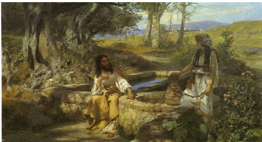
Christ and the Samaritan Woman, 1890 - Henryk Hector Siemiradzki