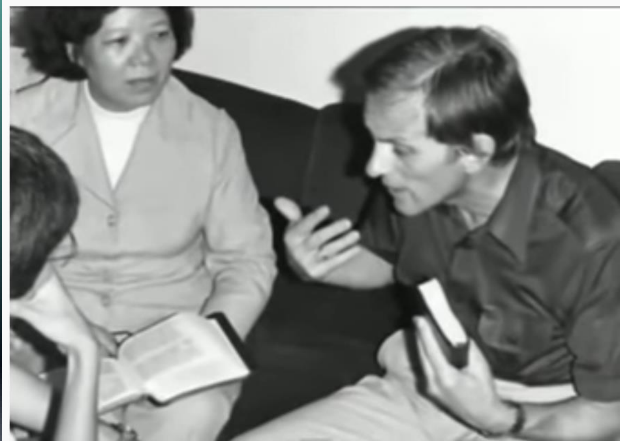
O Contrabandista de Deus - Irmão André

“Senhor, fizestes cegos enxergar, por favor cega os olhos dos que vem”