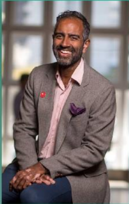
Filósofo Amol Sarva